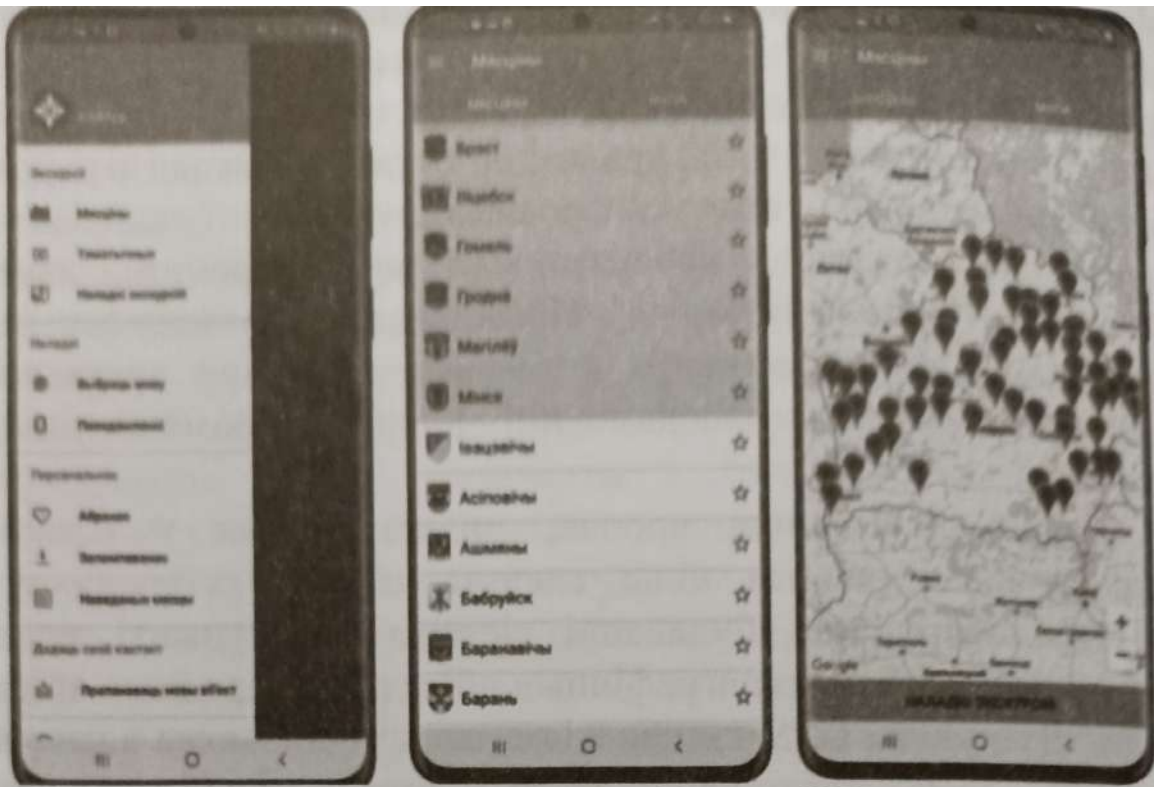
Мал. 1. Інтэрфейс Android-версіі KrokApp

Складанне апісанняў слаўтасцяў праходзіць у некалькі этапаў. Лінгвісты рыхтуюць тэкставае паведамленне аб аб'екце, якое затым праходзіць праверку ў Інстытуце гісторыі НАН Беларусі. На наступным этапе ажыццяўляецца яго пераклад і агучванне. Да інфармацыі аб аб'екце дадаюцца іх фатаграфіі і GPS-каардынаты. Уся інфармацыя захоўваецца ў кансолі праграмы. Гэта важны інструмент у праграмаванні, які выкарыстоўваецца для ўзаемадзеяння з праграмай. У кансолі ажыццяўляецца ўвод і вывад аўдыя- і тэкставай інфармацыі, адсочванне працы аўдыягіда, кіраванне файламі і многае іншае. Кансоль прадстаўляе разнастайныя магчымасці, такія як налады, тэставанне функцый, пошук і выпраўленне памылак (малюнак 2).