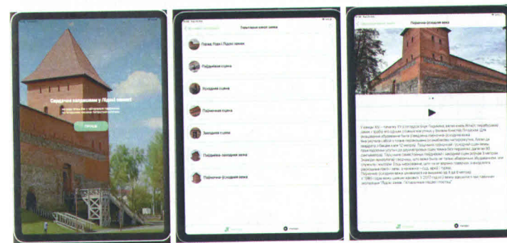
Мал. 2. iOS-версія аўдыягіда Лідскі замак

Аўдыягід па Лідскім замку з'яўляецца каштоўным інструментам для азнаямлення з аб'ектамі адзінага на тэрыторыі Беларусі дзеючага замка-кастэля [8]. Ён пагрузіць наведвальніка ў гістарычную атмасферу Лідскага замка, прадэманструе экспазіцыі вонкавага агляду, веж Гедыміна і Вітаўта (мал. 2). Кожная экспазіцыя прадстаўляе выяву экспаната ці часткі замка, кароткае тэкставае апісанне і агучаны аўдыяфайл на абранай мове. Праграма даступна ў вэб- і iOS-версіях на беларускай, англійскай, літоўскай, рускай, польскай і кітайскай мовах.